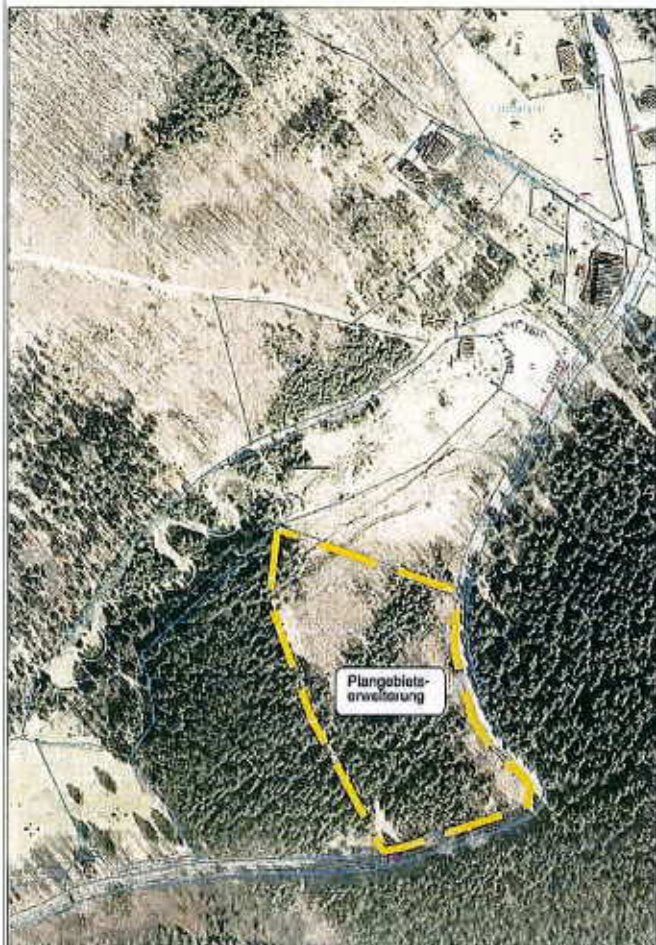
Anlage zum Aufstellungsbeschluss B-Plan Sommerrodelbahn – 1. Änderung am 30.04.2013 – Kartenausschnitt