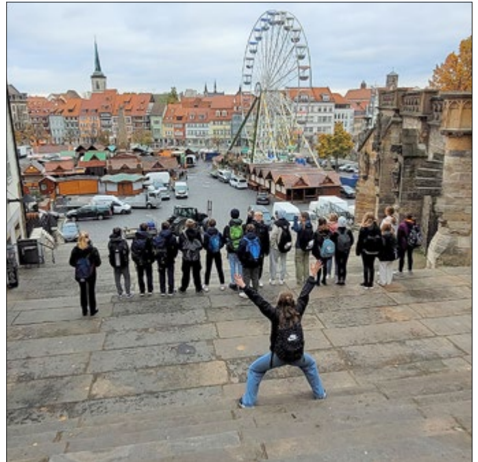
Klasse 7 in Erfurt

Für unsere Siebtklässler ging es am 17. November in der Landeshauptstadt auf Entdeckungstour in den Erfurter Dom und die alte Synagoge. Gerade in Zeiten wie den jetzigen ist es wichtig, den Kids zu zeigen, dass man mit offenen Augen aufgeschlossen für das Andere durchs Leben gehen kann.