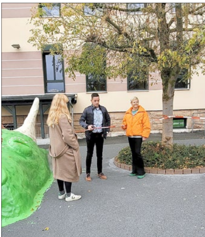
Eröffnung des Drachens