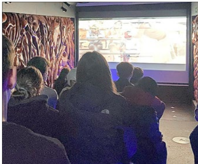
Revolution Train Klassen 8

Manchmal fällt es schon schwer, unter den derzeitigen Bedingungen das alltägliche Lächeln zu bewahren oder die richtigen motivierenden Worte zu finden. Wir bleiben zuversichtlich und suchen nach Lösungen, sind aber auch für Unterstützung aller Art sehr dankbar. Auch unter schweren Bedingungen ermöglichen wir, den Schülerinnen und Schülern tolle Ausflüge, Projekte und Lernen außerhalb des Klassenraumes. Seit den Herbstferien kamen auch einige Projekte zusammen: