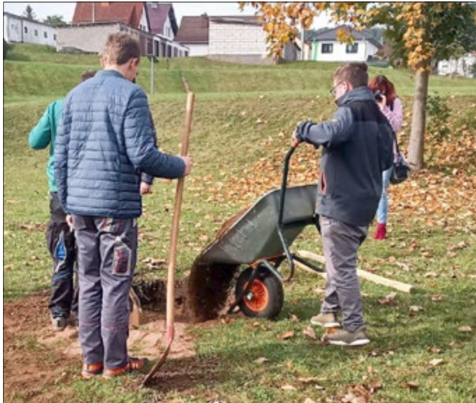
Anlegen der Streuobstwiese

Weiter ging es in Kooperation mit dem Lerndorf, dem Kindergarten und der Stadt Brotterode-Trusetal beim Pflanzen der ersten Bäume für eine zukünftige Streuobstwiese. Diese entsteht beim Kindergarten im Ortsteil Trusetal, es wurden drei Apfelbäume gesetzt. Die Schülerinnen und Schüler der Klasse 9c wurden im Anschluss im Kindergarten mit selbstgebackenem Kuchen belohnt.