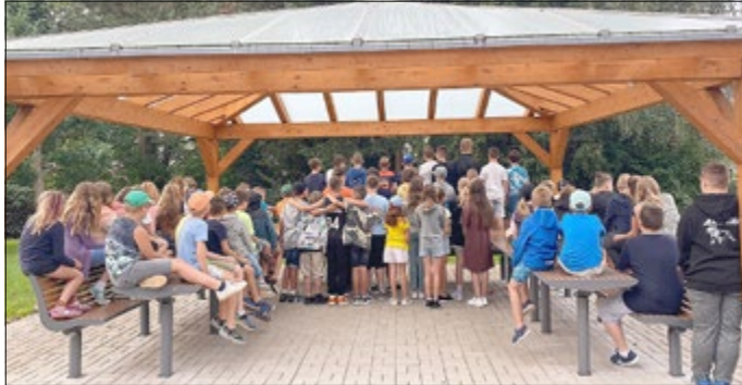
1. Schultag Klasse 5