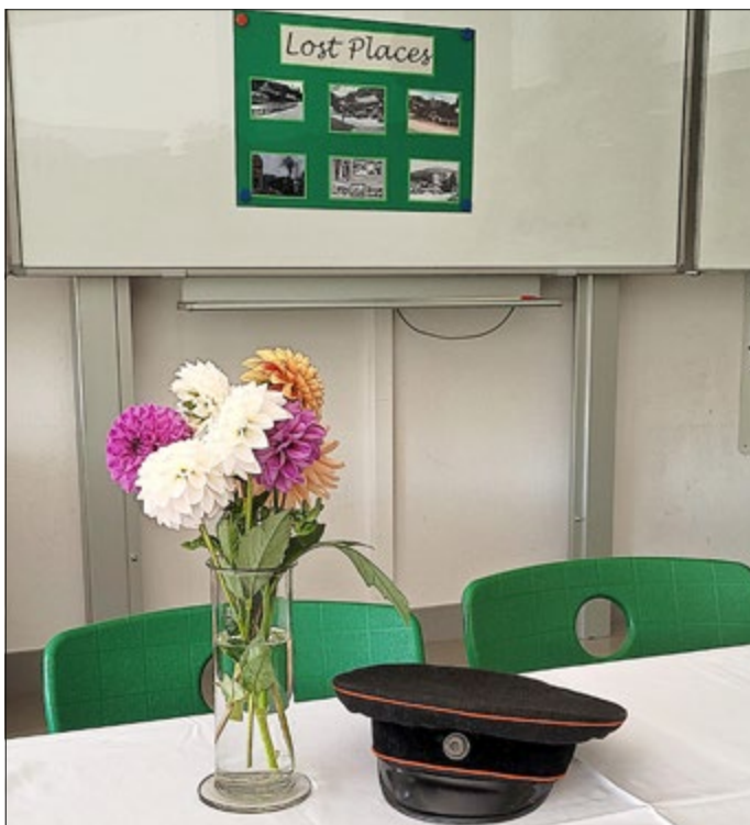
Kurzpräsentation der Zehntklässler

Eine Woche später stellten die Schülerinnen und Schüler der 10. Klassen die Themen ihrer Projektarbeiten vor.