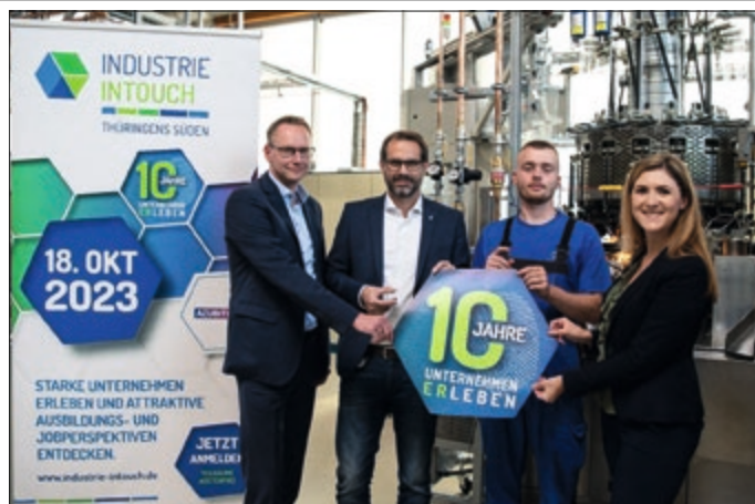
Am 18. Oktober 2023 öffnen 38 Unternehmen der Region für Besucher ihre Tore.

Am 1. September 2023 startet unter www.industrie-intouch.de die Besucheranmeldung für die Unternehmensrundgänge. Auf der Website finden sich die 38 beteiligten Unternehmen inkl. ihrer Programmhilights und allen Informationen zu INDUSTRIE INTOUCH 2023. Individuelle Veranstaltungshinweise der Unternehmen sind dort ebenfalls einsehbar. Mit einer frühzeitigen Anmeldung sichern sich Interessierte ihre Teilnahme am Event und können sich ein Wunsch-Besuchsprogramm zusammenstellen. Die Anmeldung zur „AZUBI TOUR“ erfolgt ebenso innerhalb der Online-Anmeldung. Die Plätze in den Unternehmen sind teilweise limitiert und die Teilnahme ist kostenfrei. Am Veranstaltungstag öffnen sich ab 16 Uhr die Werkhallen. Die Anfahrt zum Unternehmen erfolgt durch die Besucher in Eigenregie.