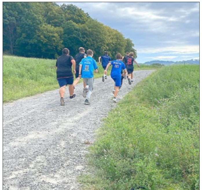
Sportfest am 19. und 21. September

Rund um den Kindertag fand unser Sportfest auf der Kleinsportanlage in den Disziplinen Kugelstoßen und Weitwurf sowie Sprint und auf dem Hofberg in der Disziplin Crosslauf statt.