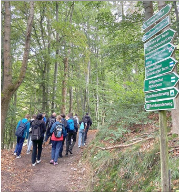
Wandertag 22. September / Alle Bilder: TGS

Und am 22. September hieß es dann für alle Klassen zum ersten Wandertag des Schuljahres raus in die Natur.