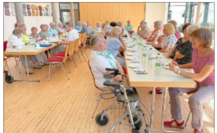
Veranstaltung am 04.09.2023