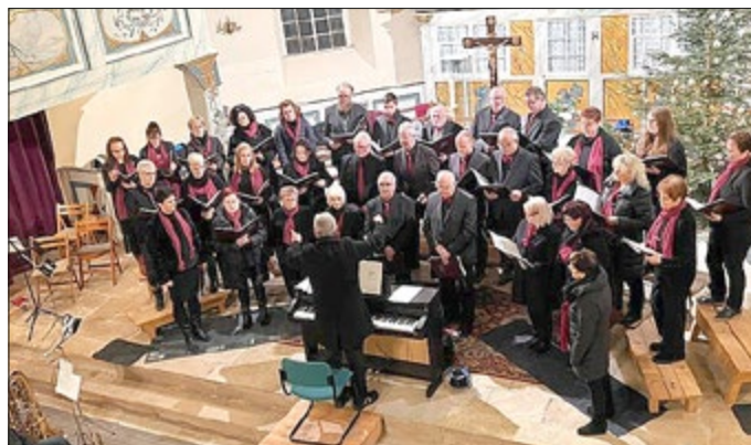
1. Konzert nach der Pandemiezeit im Dezember 2022