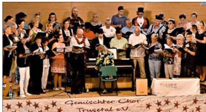
Der GC Trusetal bei seinem letzten Konzert im Rathaus mit dem Motto „Film ab, Ton läuft“ im Jahr 2018