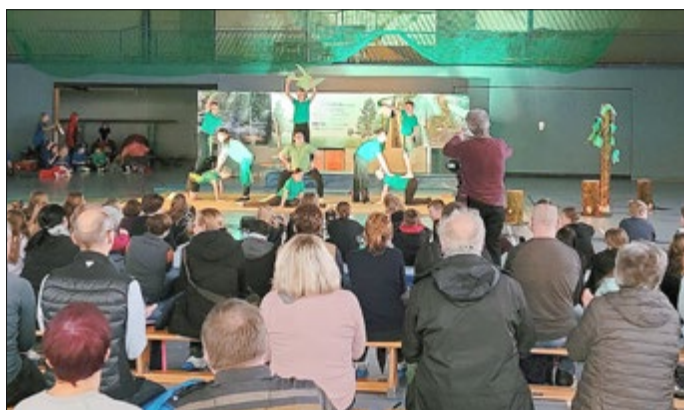
Zirkusprojekt Klasse 5

Eine Woche hatten die Kinder Zeit, Kunststücke zu lernen, verschiedene Requisiten auszuprobieren, eine Geschichte zu entwickeln und diese als Show am Freitag der Schulgemeinschaft und den Eltern zu präsentieren.