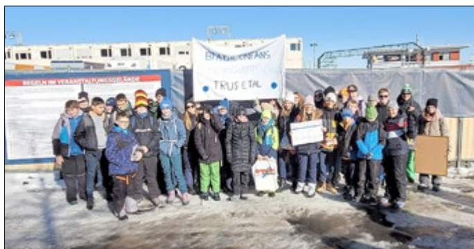
Biathlon in Oberhof

Zwei Tage später ging es für circa 40 Kids aus unserer Schule sportlich unter dem Motto „Jugend trifft Biathlon“ weiter. In einem super vom Thüringer Skiverband organisierten Projekt ging es für die Klassen 6b und 8a nach Oberhof zur Biathlon-Weltmeisterschaft. Von ihren Plätzen direkt am Schießstand aus konnten sie die Topbiathleten aus aller Welt bei der Mixed Staffel anfeuern. Auch wenn es für das deutsche Team am Ende nur für Platz 6 reichte, für die Schülerinnen und Schüler war es ein unvergessliches Erlebnis.