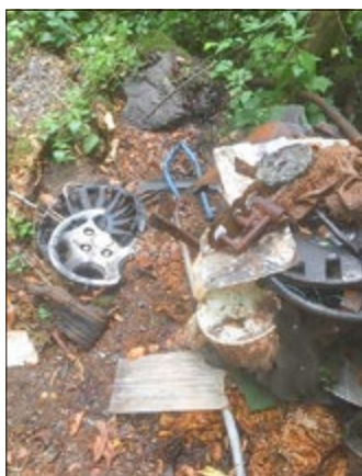
Wäldchen Ortseingang Brotterode (Bereich Drahthammer)

...leider sehen das einige Bürger unserer Stadt nicht so. Mittlerweile erhalten wir wöchentlich Meldungen über illegale Müllablagerungen, vor allem in unseren Wäldern. Von Gartenabfällen, Sperrmüll, Lebensmittelresten, Bauschutt, Schrott aus Garagenauflösungen etc. ist alles dabei.