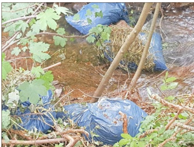
Inselwasser Brotterode (Bereich Platz „St. Martin-Le Vinoux“)

Auf diesem Weg möchten wir uns trotzdem bei den aufmerksamen Mitmenschen bedanken, die uns regelmäßig in Kenntnis setzen und uns ab und an Informationen zu den Verursachern geben. Einige Fälle konnten aufgrund dessen zur Anzeige gebracht bzw. geahndet werden. Es sind auch die Einwohner lobenswert zu erwähnen, die in ihrer Freizeit beständig den Müll Anderer einsammeln und so einen großen Beitrag für ein anschauliches Ortsbild leisten. Vielen Dank!