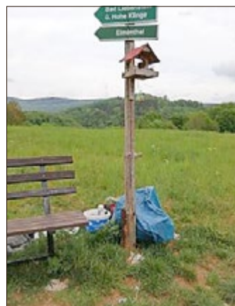
Rastplätzchen zwischen Elmenthal und Laudенbach