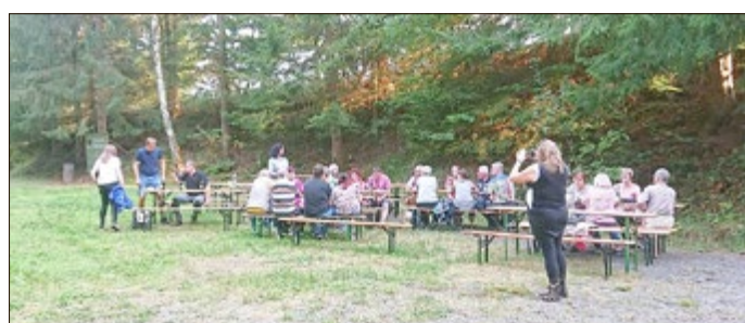
Foto: Treffen auf dem Lauderbacher Dorfplatz

Leider können wir uns aufgrund der Einschränkungen noch nicht wieder zu unseren Proben treffen und konnten damit auch noch nicht mit den Vorbereitungen zu unserem traditionellen Weihnachtskonzert beginnen. Ob und in welcher Form das Konzert überhaupt stattfinden kann, bleibt noch offen. Wir werden Sie und Euch aber sobald es möglich wird hier im Amtsblatt, auf Facebook oder unserer Homepage unter www.gemischter-chor-trusetal.de darüber informieren.