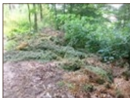
Wahles Bereich Friedhof (Weg darunter)

Auf diesem Weg möchten wir uns trotzdem bei den aufmerksamen Mitmenschen bedanken, die uns regelmäßig in Kenntnis setzen und uns ab und an Informationen zu den Verursachern geben. Einige Fälle konnten aufgrund dessen zur Anzeige gebracht bzw. geahndet werden. Es sind auch die Einwohner lobenswert zu erwähnen, die in ihrer Freizeit beständig den Müll Anderer einsammeln und so einen großen Beitrag für ein anschauliches Ortsbild leisten. Vielen Dank!