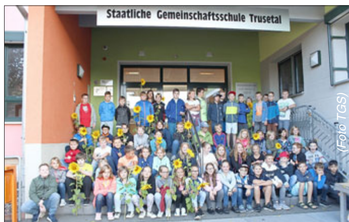
Die neuen Fünftklässler der Gemeinschaftsschule Trusetal

Schließlich entdeckten die Fünftklässler ihre Klassenräume und das Schulhaus, hörten wichtige Informationen und lernten ihre Klassenkameraden bei verschiedenen Aktivitäten kennen. So wurden Namensschilder gebastelt, Hefter und Bücher vorbereitet, eine Schulhausrallye durchgeführt und vieles mehr.