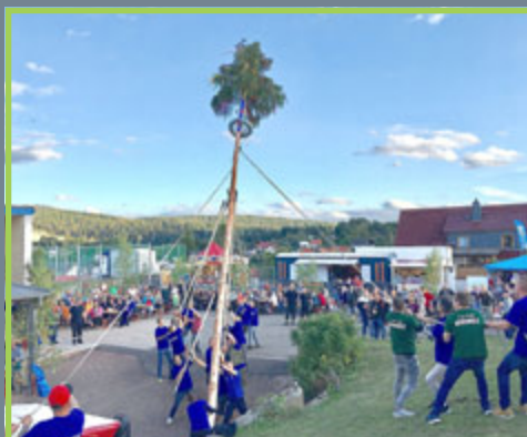
Setzen der Kirmestanne