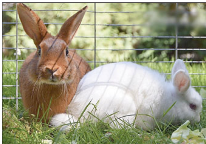
Felix und Alfred: sind kastriert und geimpft

Anfragen bitte an: Tierschutzverein Schmalkalden (03683/488044)