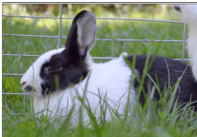
Brunhilde: ist geimpft