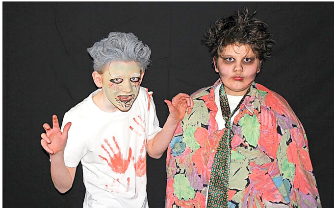
Mottogetreu lehrte man sich am Faschingsabend gegenseitig das Fürchten.

Am 7. Februar fand an der TGS Trusetal der traditionelle Schulfasching statt. Unter dem Motto „Horror und Grusel“ gestalteten die Klassen 10 a und 10 b das Event in diesem Jahr in der Sporthalle. Anleitung erhielten sie von Philipp Fraunholz und Gabriele Reum. So entstand ein buntes und kurzweiliges Programm aus Klassenbeiträgen, Tanzeinlagen und Spielen. Eine Saalpolonaise gehörte ebenso dazu wie die kulinarische Versorgung mit Würstchen und Getränken durch die Klasse 8 a.