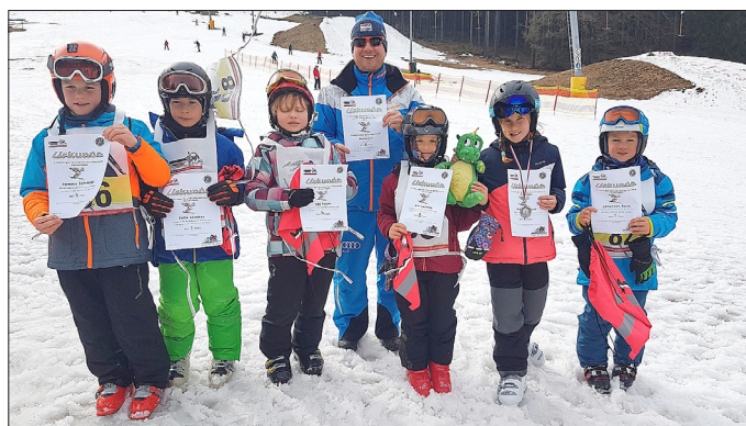
Text/Foto: A. Nickel-Dietzel

Die Kinder zeigten sich auf den alpinen Brettern super in Form und der Jubel über Platz 5, Urkunden und Medaillen war groß. Ein besonderer Dank geht an den ausrichtenden Verein vor Ort, den TSV, alle Trainer und Betreuer.