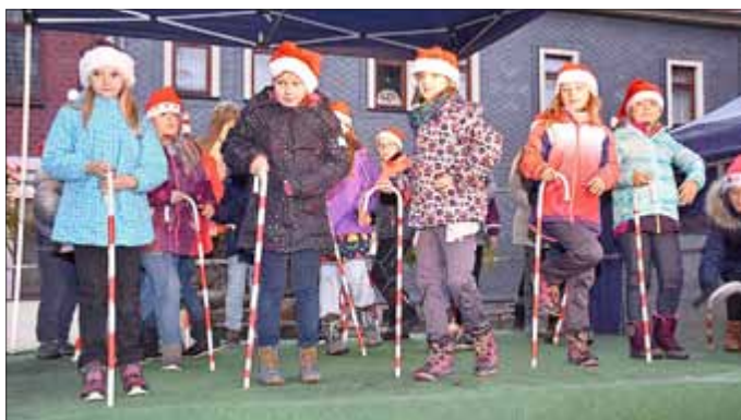
Ein Programmhilighlight des Brotteröder Adventsmarktes

Am Sonntag, den 09.12.2018 konnten sich die Bürgerinnen und Bürger am traditionellen Adventsmarkt im Ortsteil Brotterode erfreuen. Auch in diesem Jahr haben viele Gäste die Veranstaltung besucht. Ein herzliches Dankeschön an die Tourismus GmbH, die Grundschule Brotterode und dem Kindergarten Brotterode, sowie den weiteren Teilnehmern, die sich am unterhaltsamen Weihnachtsprogramm beteiligten. Natürlich danken wir auch den vielen fleißigen Helfern, die zum guten Gelingen dieser Veranstaltung beitragen haben.