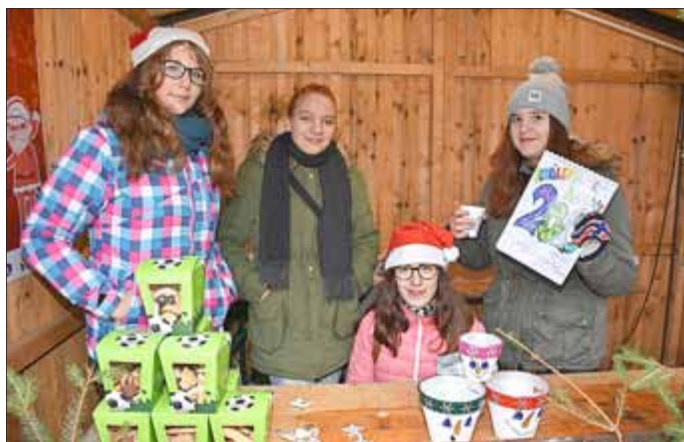
Schülerinnen der Gemeinschaftsschule präsentieren selbst angefertigte Geschenkkideen

Der Adventsmarkt in Trusetal wurde am Sonntag, den 16.12.2018 durchgeführt. Zahlreiche Besucher konnten bei weihnachtlichem Gaumenschmaus einen angenehmen Nachmittag verbringen. Ein herzliches Dankeschön den Organisatoren, den Akteuren, die für ein weihnachtliches Programm sorgten und allen weiteren Mitwirkenden dieses Adventsmarktes. Gastgeber in diesem Jahr waren die Feuerwehr Trusetal, der Gemischte Chor Trusetal und das DRK OV Trusetal. Danke.