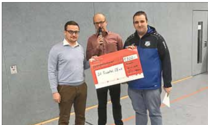
offizielle Scheckübergabe beim Hallenturnier des SV Trusetal 05 um den Wasserfallpokal

Am Freitag, den 21.12.2018 fand das Hallenturnier des SV Trusetal 05 um den Wasserfallpokal statt. In diesem Rahmen wurde den Vereinsmitgliedern von der Rhön-Rennsteig-Sparkasse ein Scheck als Zuwendung für ehrenamtliches Engagement für das Gemeinwohl überreicht.