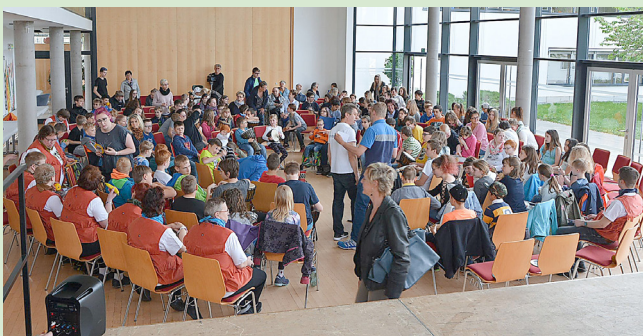
Drumcircle im Rathausaal

Anlässlich des 5. Mai, dem Europäischen Protesttag zur Gleichstellung von Menschen mit Behinderung, gab es eine Aktionswoche vom 2. bis 4. Mai mit vielen begeisternden Angeboten für die Gemeinschaftsschule, Diakoniewerkstatt, Pestalozzischule, Kindergarten Trusetal und Grundschule Brotterode.