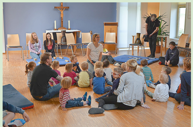
Zusätzlich fand ein Projekt im Kindergarten Trusetal statt.

Am 3. und 4. Mai hieß es dann „Lernen unter einem Dach“ mit Disco, Experimenten, Tanz- und Graffitiworkshops.