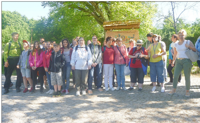
Besuch der Schlossmühle Tonndorf