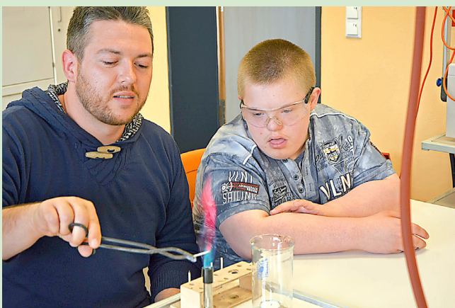
Gemeinsames Experimentieren

Am 2. Mai fand das „Mitmachevent“ statt. Schüler sowie Menschen mit und ohne Behinderung trommelten gemeinsam und entwickelten große Begeisterung für die Percussion-Rhythmen.