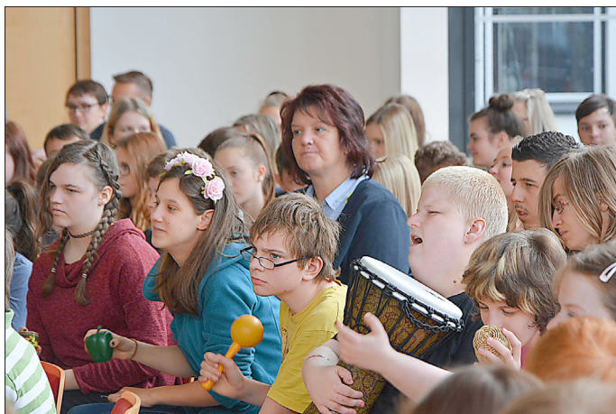
Drumcircle im Rathausaal