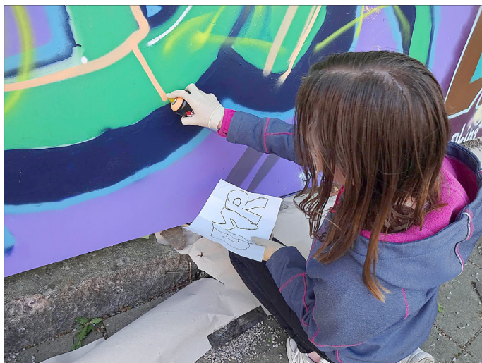
„Lernen unter einem Dach“ Graffitiworkshop