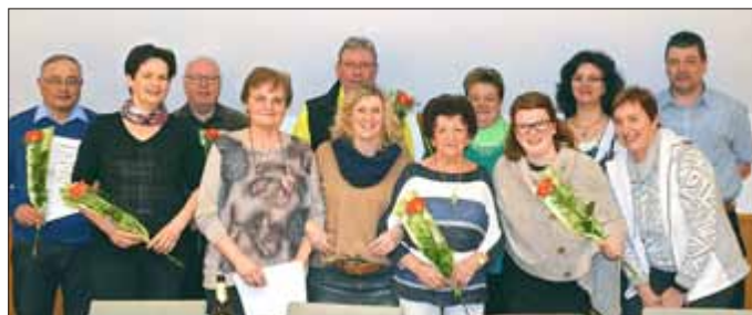
Vorstand und ausgezeichnete Mitglieder des Gemischen Chors Trusetal e. V.

In diesem Sinne wünschen wir allen einen schönen Frühling und sehen uns hoffentlich am 26. Mai 2018.