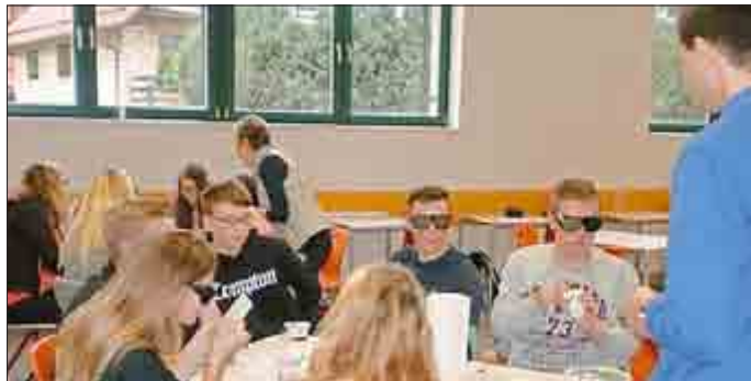
Mittels spezieller Brillen wurden altersbedingte Beeinträchtigungen der Sehkraft verdeutlicht.