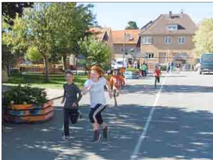
Schüler der Klasse beim Spendenlauf