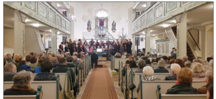
GC Trusetal Weihnachtskonzert 2019

PS: Eine kleine zumindest bildliche Erinnerung an unser fantastisches Konzert im Jahr 2019