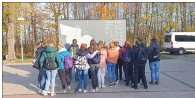
Klassen 10 in Buchenwald

Mit einem ähnlichen Thema beschäftigten sich zusätzlich zur Klasse 5b auch die Schülerinnen und Schüler der 6b und 5a, die bei einem gemeinsamen Theaterbesuch in Meiningen das Stück „Der Junge, der einen Wald pflanzte“ schauten.