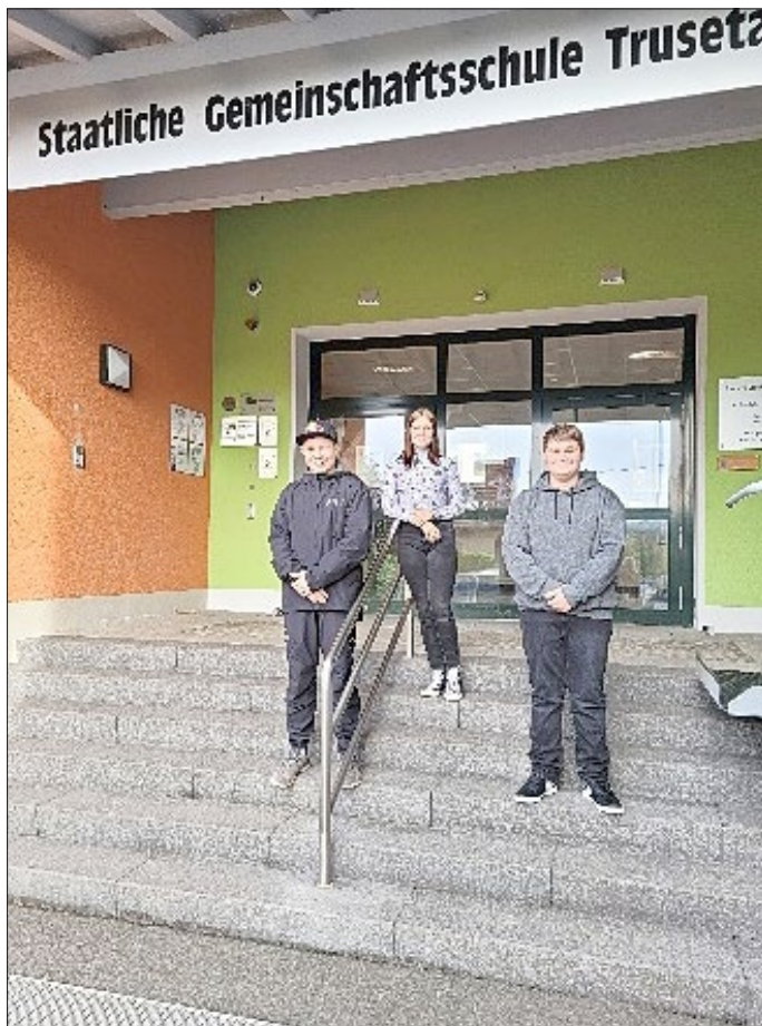
Die neu gewählten Schülersprecher.

Das sonnige Herbstwetter nutzen wir am 07. Oktober, um den im September ausgefallenen Wandertag nachzuholen. Bei anfangs noch eisigen Temperaturen erkundeten einige Klassen die nähere Umgebung und erwanderten bei später strahlendem Sonnenschein Laudenbach und Elmenthal. Andere zog es in entferntere Nachbarorte wie Brotterode, Bad Liebenstein und Schmalkalden. Allen gemeinsam war, dass sie sich nachträglich am World Cleanup Day beteiligten und achtlos weggeworfenen Müll einsammelten. Es war ein in jeglicher Hinsicht gelungener und erfolgreicher Tag.