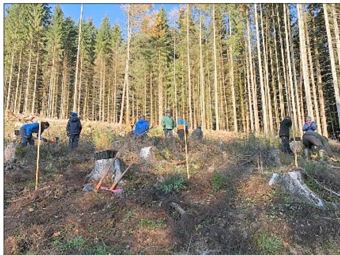
Baumpflanzaktion Klasse 5

Bereits Anfang Oktober wurde unsere Klasse 5b in einer Onlineschulung der Organisation „Plant for the planet“ zu Klimabotschafter:innen ausgebildet. Dabei ging es vor allem um den Klimawandel und was man konkret dagegen tun kann. Im November folgte nun der praktische Teil - es ging zur Baumpflanzaktion nach Schmalkalden.