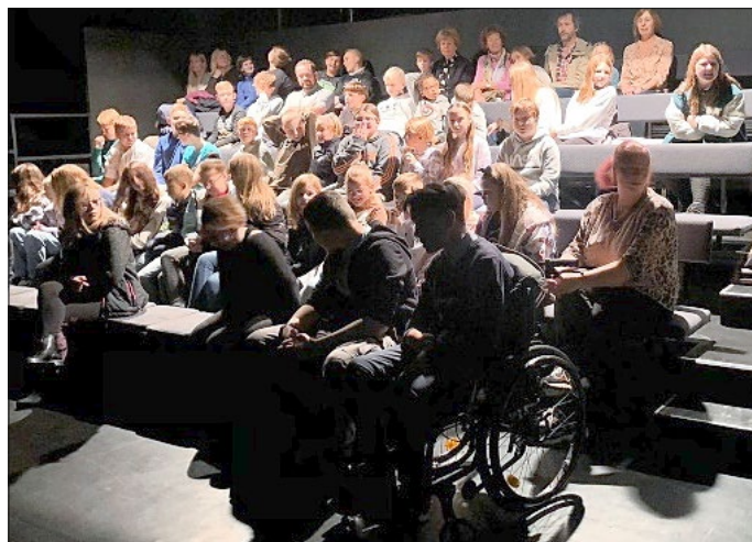
Theaterfahrt Klassen 5